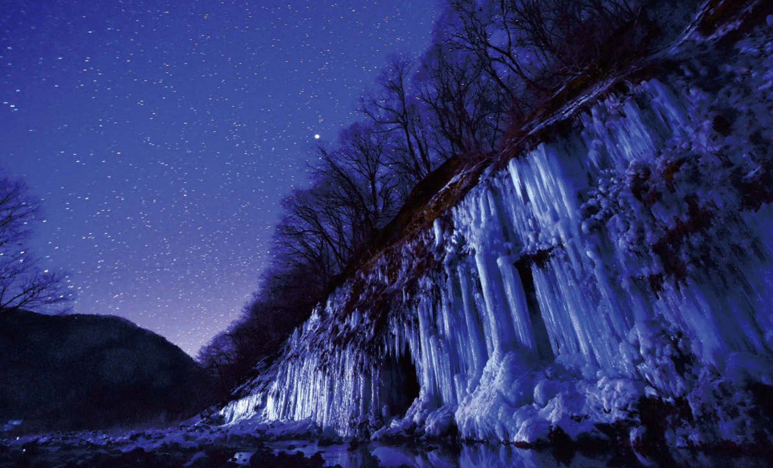
写真:『悠久の刻』 (撮影地:木曾福島)