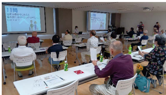
糖尿病教室にたずさわった スタッフ一同