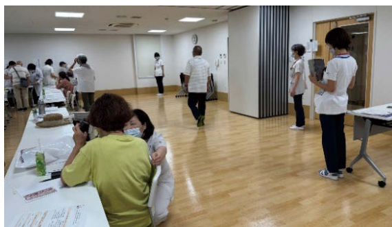
腎臓病教室にたずさわった スタッフ一同

歩き方を撮影し、AIによる歩行分析を 行い、その方に合った運動指導を行いま した。