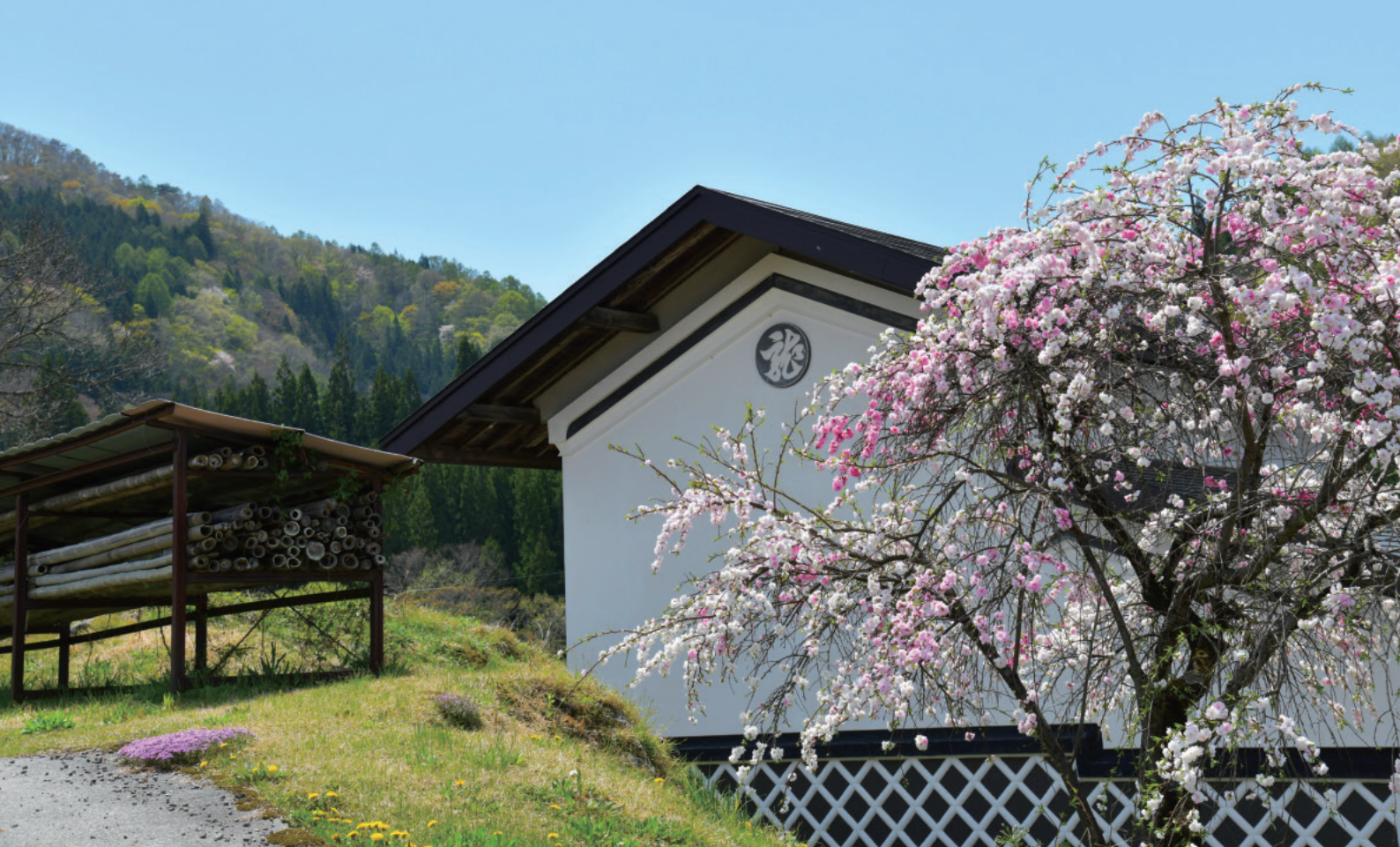
写真:『桃花の村』(撮影地:白馬村)